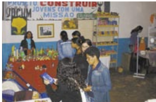
Museu com fatos e curiosidades