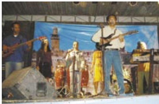
Palco da Face