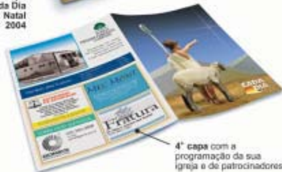
4ª capa com a programação da sua igreja e de patrocinadores