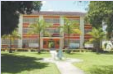
Fachada do SPN: nível dos seminários da IPB é bom, mas pode melhorar muito

Segundo as Normas , o candidato tem de ser arrolado como aspirante pelo conselho da igreja local e, "como tal, deve receber trabalho específico, com relatório anual, acompanhado pelo pastor e avaliação periódica do conselho; no entanto, deve comprovar vocação pastoral nessas atividades; nessa fase, fará leituras e estudos que lhe