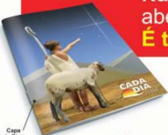
Capa Cada Dia Natal 2004

Aproveite para envolver os jovens e adolescentes da sua igreja neste ministério. Eles podem distribuir os livros nos hospitais, semáforos, na vizinhança e nos trabalhos especiais.