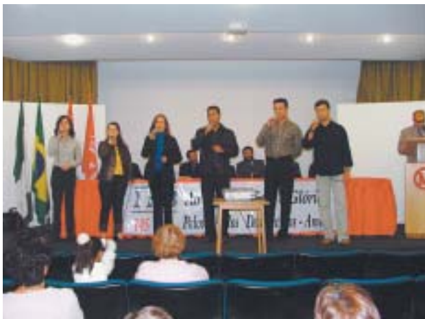
Grupo Consagração canta na comemoração do trabalho masculino do Sínodo de Piratininga