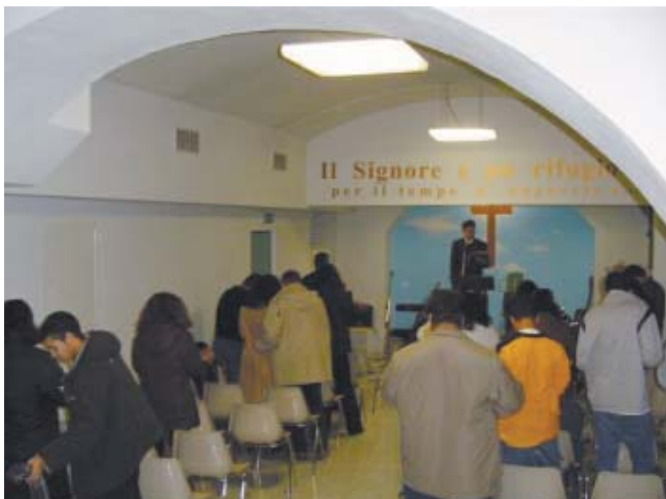
Congregação Presbiteriana em Torino, Itália

57 milhões de habitantes. Noventa e cinco por cento dos municípios não têm uma igreja evangélica identificada. É um país predominantemente católico. "O catolicismo conserva traços medievais, sem atuação espiritual viva, o que transformou a Itália num país materialista e praticamente ateu", informa o rev. Humberto.