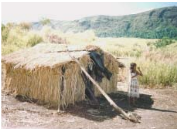
Aldeia dos Maxakalis, em Minas Gerais

trabalha segundo as necessidades locais. Apoiando e divulgando a Missão Caiuá, são formadas diversas equipes: coordenação, devocionais e evangelização, sociabilidade e evangelização de crianças, médica e enfermagem, dentária, protética, construções e reformas, serviços gerais e cozinha. Durante o período em que o Projeto SOS Índigenas permanece nas