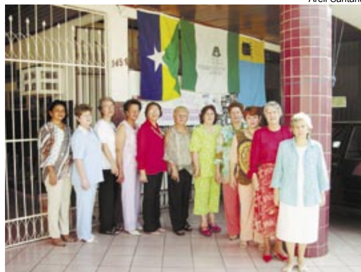
Diretoria da Confederação Nacional de SAF's, em frente ao Centro Educacional Presbiteriano XV de Novembro, em PortoVelho

BP: Então a senhora acredita que a mulher ajuda à igreja suficientemente envolvida com a SAF sem a necessidade de cargos de liderança como diaconato?