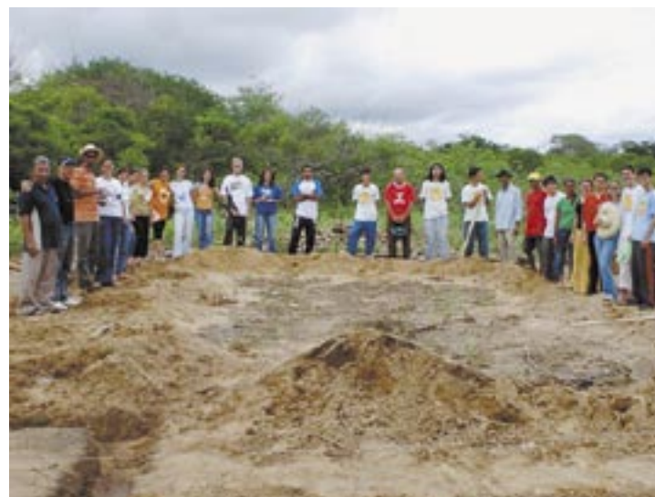
Equipe contornando os alicerces da igreja que está sendo construída em Jurema (PI)

Houve, pela primeira vez, a implantação de uma igreja em Jurema (PI). Foram mais de 683 ações realizadas naqueles municípios do Piauí, desde corte de cabelo até reuniões com prefeitos e autoridades locais. O Proav doou ainda R$ 8.313,50 às igre-