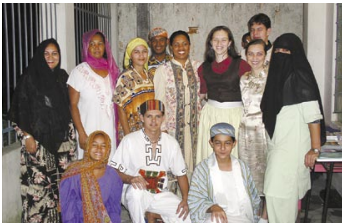
Equipe da Secretaria de Missões IP de Novo Horizonte na Feira das Nações