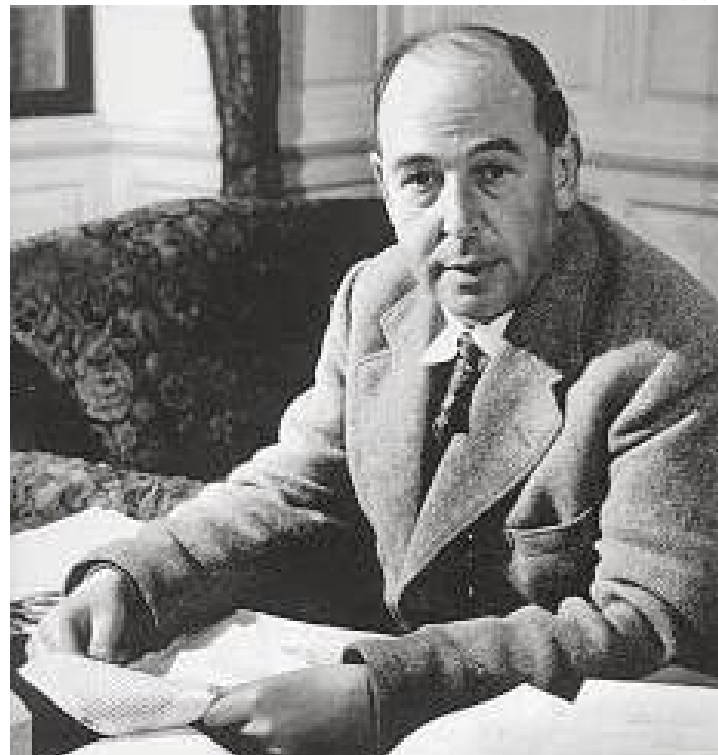
CS Lewis: autor de uma história com princípios cristãos que deve se tornar um filme popular