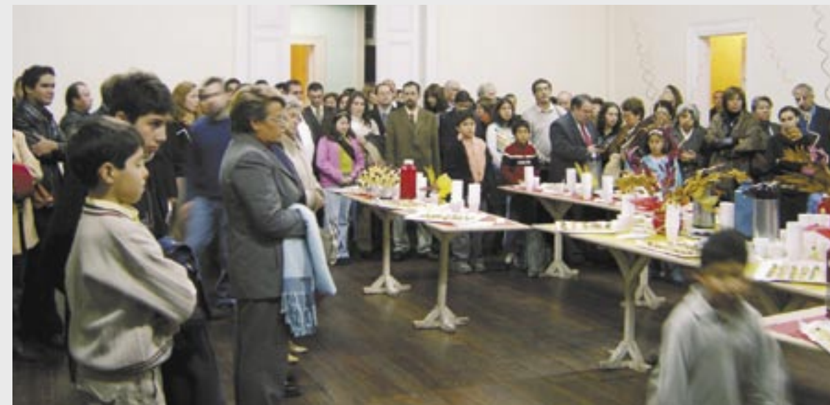
Cultos na IP de Valparaíso

gostaria”, compartilha. A tarde o pastor dedica à igreja, fazendo aconselhamentos, visitas, discipulados, reuniões de oração, estudos bíblicos etc. “E a igreja tem crescido, com a graça de Deus! Nos oito primeiros meses teve um crescimento de mais de 50%! Tinha 16 membros e agora está chegando a trinta, reunindo em média setenta pessoas por reunião”, entusiasma-se o pastor. Ele também realiza estudos bíblicos em um bairro onde se reúnem cerca de quinze pessoas, das quais 90% são católicas. Em breve, no mesmo local serão reunidas as crianças.