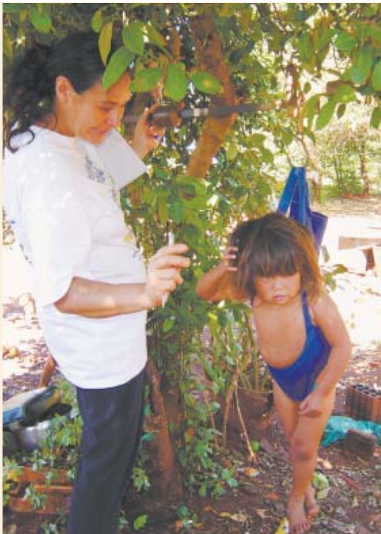
Avaliação do peso das crianças para controle nutricional