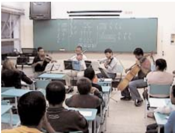
Primeira aula da futura orquestra Mackenzie Tamboré

no dia 14 de maio, serão divididas em três fases: inicialmente, de maio a julho, os alunos assistirão aulas teóricas. Segundo o presb Kerr, 90% dos inscritos não conhecem teoria musical. A