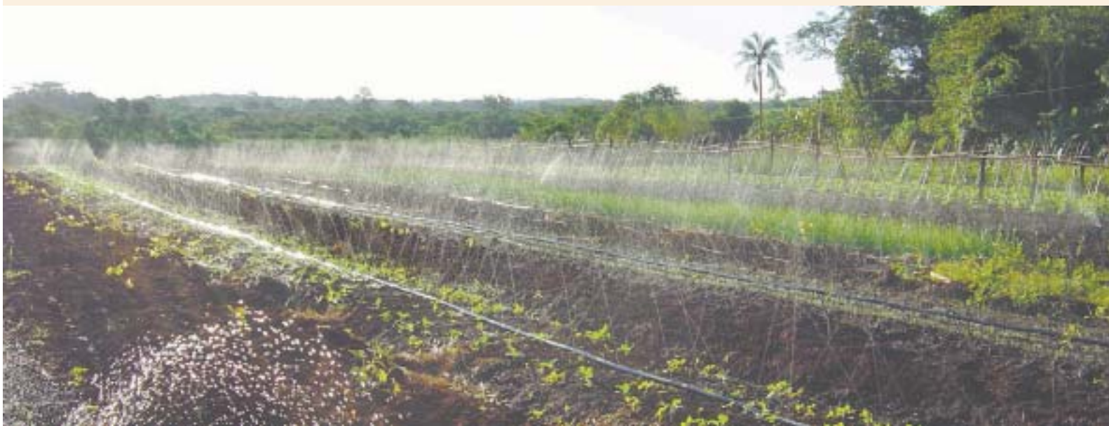
Horta que abastece o Centrinho e outros departamentos da missão

cluído e lançado em fevereiro de 1986. Vários livros do Velho Testamento também estão publicados e outros estão sendo preparados. Além disso, a equipe de tradução preparou o hinário em caiuá, que é usado regularmente nos trabalhos da missão. Também se encontram em uso os filmes Jesus, A História de José, A História de Abraão e O Dilúvio , em que os próprios índios fizeram a dublagem, e