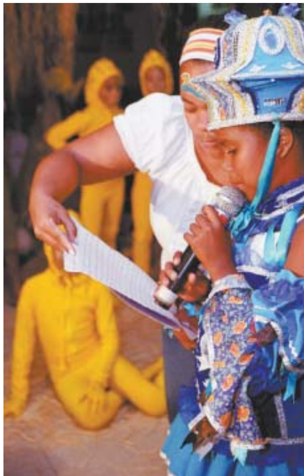
Ação do Programa de Promoção da Criança e do Adolescente (PPCA)

mente nova e vem sendo aperfeiçoado no decorrer dos últimos dois anos”, explica o diretor.