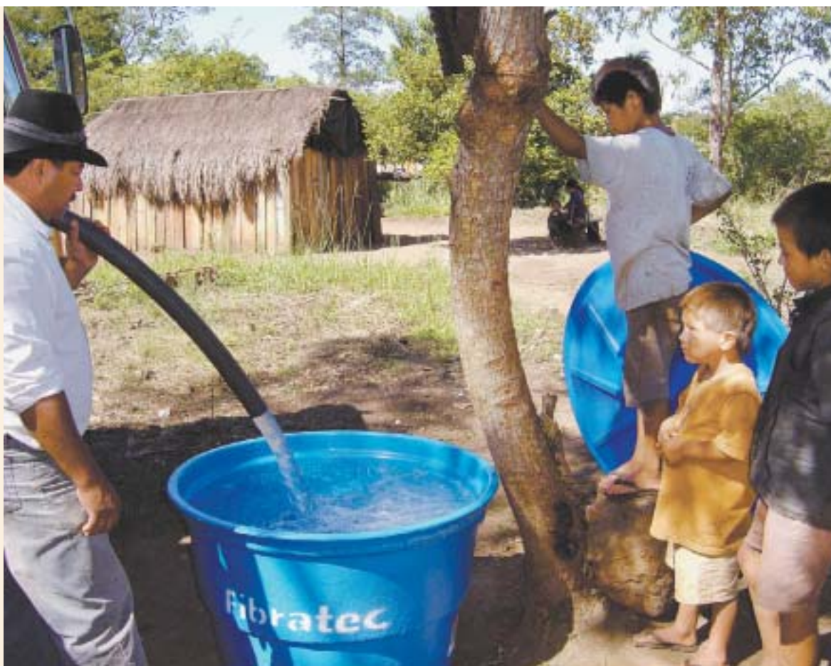
Abastecimento de água potável – solução emergencial enquanto a rede de saneamento básico não é estruturada

Padilha afirma que nos quatro meses do início deste ano, a Funasa, com o auxílio da Secretaria Municipal de Saúde de Dourados e da Missão Caiuá, desenvolveu os indicadores de saúde da região. O Pólo Base da Funasa, em Dourados, monitora permanentemente 402 crianças. Segundo ele, de fevereiro a abril, houve redução de 100% de crianças em estado grave de desnutrição, 42,8% de redução