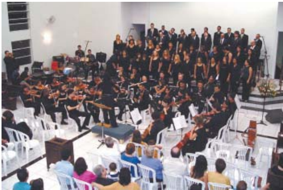
Culto de aniversário contou com participação do Coral e Orquestra da Igreja Batista do Barro Preto, em Belo Horizonte