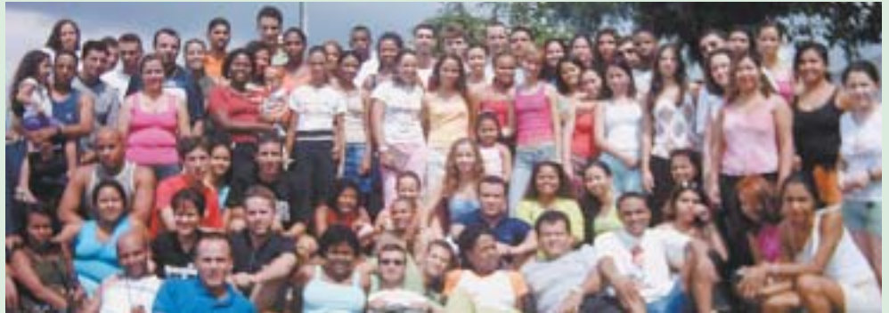
Participantes do 12º ICC da UMP Rio de Janeiro

Primeiro Simpósio Relâmpago de Evangelização em Porto Alegre Nos dias 22 a 25 de abril aconteceu o