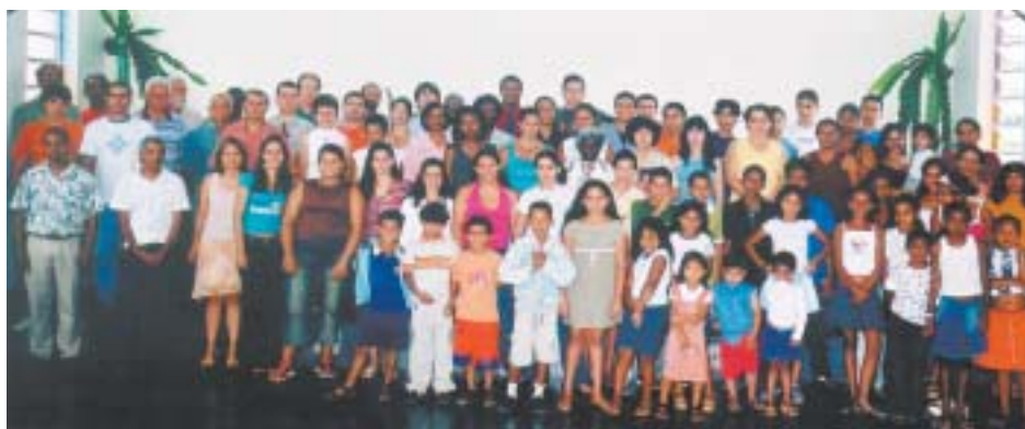
Membros da igreja em festa

gelística muito voltada para a congregação local, não havendo uma maior disposição de se plantar novas igrejas. Quando se iniciava um novo trabalho de estudo bíblico e orações, estes eram normalmente realizados em bairros periféricos, o que dificultava a presença dos irmãos nas reuniões. Além disso, Juiz de Fora é uma cidade com grande número de católicos praticantes e o Espiritismo Kardecista também possui grande número de adeptos.