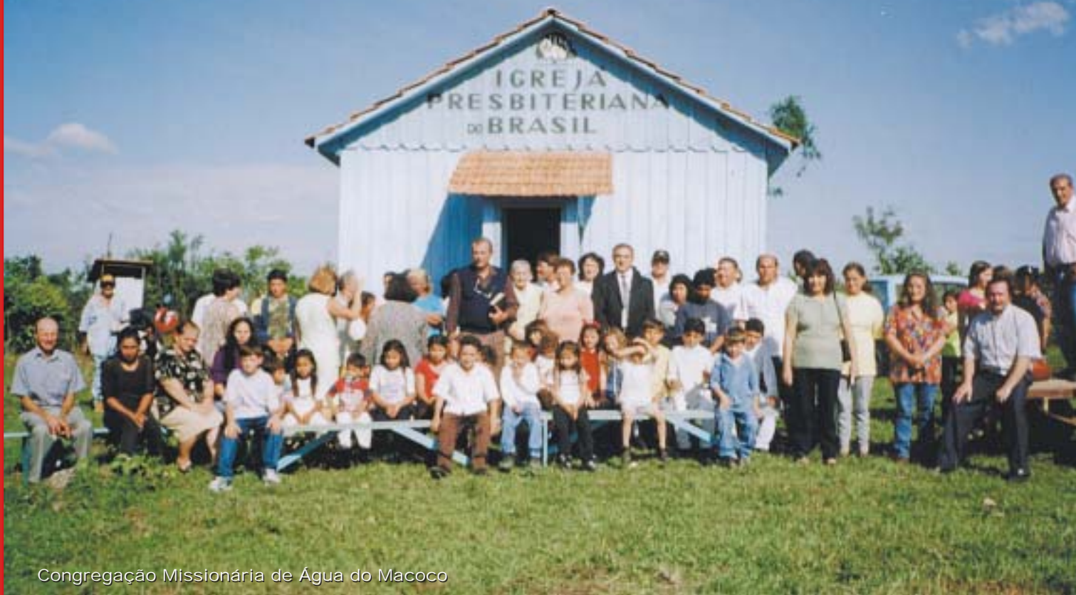
Congregação Missionária de Água do Macoco