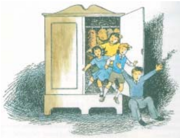
As crianças descobrem um guarda-roupas mágico

hando no projeto e espero que seja uma produção maravilhosa e mágica, cheia de emoção e atração, e que, ao mesmo tempo levante questões importantes sobre coisas que realmente importam". Para ele, As Crônicas de Nárnia cativam tanto crianças quanto adultos por serem histórias que contêm verdades essenciais associadas a histórias de aventura e beleza, excepcionalmente bem escritas e imaginadas, e que,