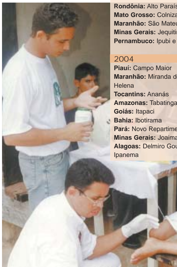
Voluntários atendem criança em ação da JMN