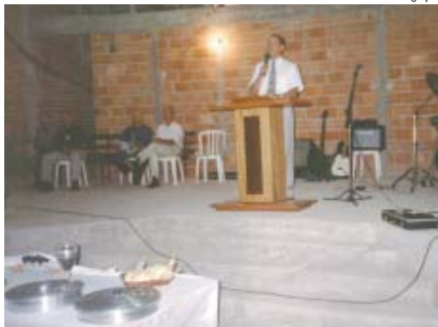
Santa Ceia no novo templo da IP de Aroeira

Os anos seguintes foram de luta para concretizar o sonho. Só para aprovação do projeto na prefeitura, foram necessários dois anos de espera. Mas enquanto as obras avançavam, a igreja continuou trabalhando,