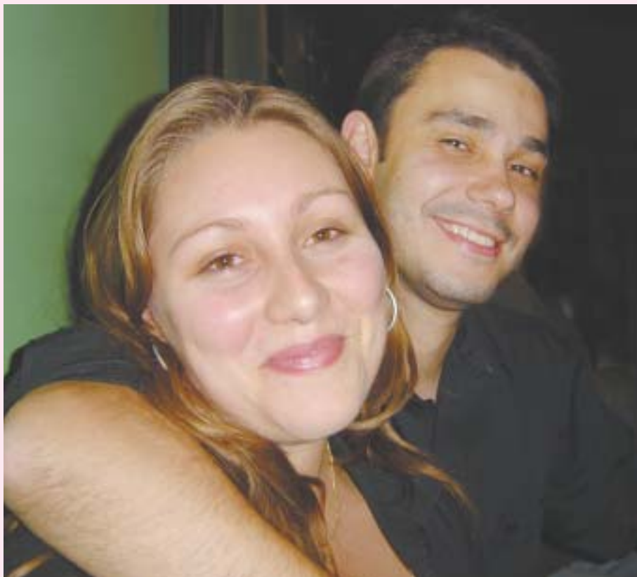
Casais de namorados cristãos que se relacionam à luz da Palavra ainda são a maioria, mas o crescimento do número dos que não agem assim é preocupante