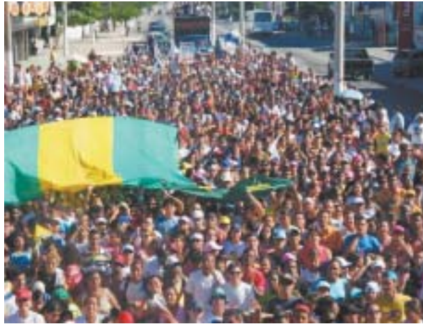
Marcha em Cabo Frio reúne várias denominações para adorar a Deus e impactar a cidade

A jornalista fez uma definição sobre as duas manifestações, chamando a parada de reunião de uma multidão e a marcha de reunião de uma massa. Mônica Waldvogel afirmou que a multidão reunia milhares de pessoas diferentes, que não julgavam a forma de ser, agir e pensar umas das outras, unidas para celebrar a diversidade. Já a marcha, ela classificou de uma massa de pessoas reunidas num único pensamento exclusivista, certas de que apenas seu modo de pensar é o certo. Ela disse que esse tipo de manifestação é até perigosa, quando massas se unem para ditar o que é certo ou errado e excluem