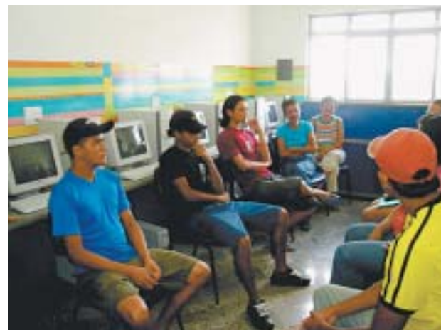
Alunos de uma das turmas da Estação Digital Koynonia: inclusão digital para levar desenvolvimento às pessoas e alcançá-las para o evangelho

ca adequada até os equipamentos. Por sua vez, a Fundação Hospital do Câncer colocou toda a estrutura recebida nas dependências da igreja, que passa a administrar o dia-a-dia da estação, prestando contas à Fundação Hospital do Câncer", explica Daniel.