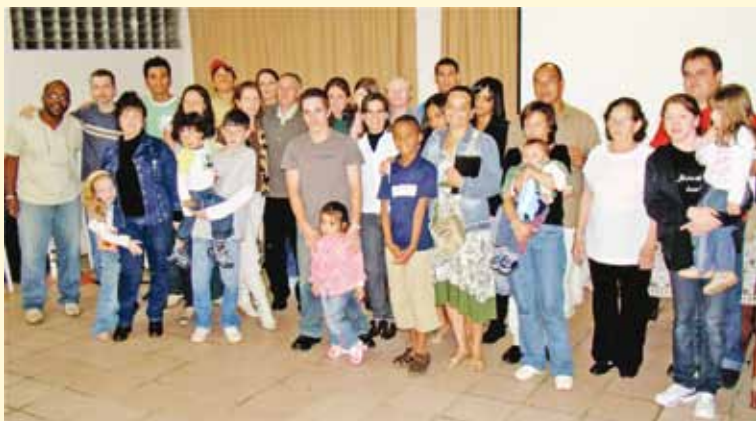
A IP de São Mateus do Sul tem 65 membros

As obras do novo templo entraram na reta final. Já foram levantadas as paredes da área principal, que terá capacidade para cerca de 160 pessoas, além de salas de aula para a Escola Dominical e, futuramente, dependências para sua Escola de Música .