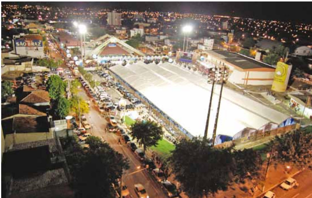
O evento, como nos anos anteriores, será realizado no espaço conhecido como Parque do Povo

Para realizar esse megaevento a VINACC sempre contou e contará em 2010 com o apoio de 70% das igrejas evangélicas da Paraíba, que são representadas pela Ordem dos Ministros Evangélicos do Brasil e no Exterior – OMEBE/Conselho da Paraíba, e da Associação dos Pastores Evangélicos do Estado da Paraíba – APEP, e do Presbitério da Borborema, com sede em Campina Grande, na Paraíba.