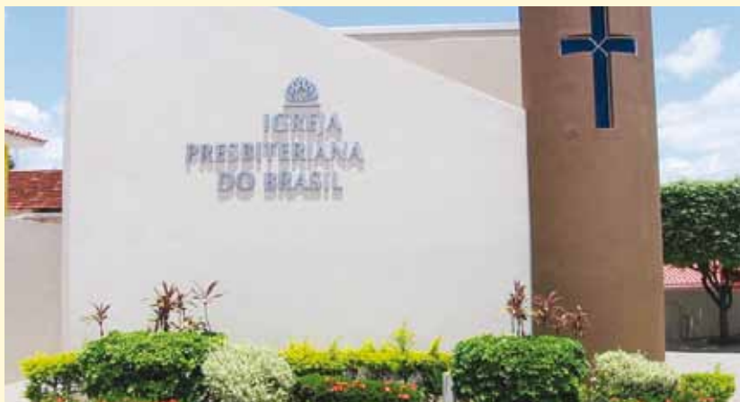
A IP de Dracena fica em São Paulo

O evento foi amplamente divulgado pela imprensa local. A Câmara Municipal de Dracena aprovou requerimento, datado de 27/10/2009, de dois vereadores consignando votos de congratulações, agradecendo “pela singular contribuição às atividades desenvolvidas pela Igreja, que conta com muitos projetos sociais, inclusive, em prol de crianças carentes de nosso município, trazendo inúmeros benefícios à nossa comunidade.