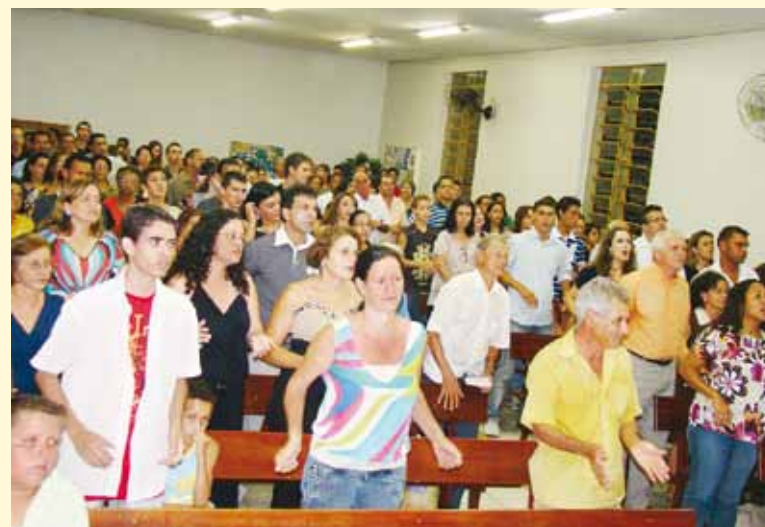
Foi no dia 09 de dezembro que a congregação foi organizada em igreja

A IP do Setor Pedro Ludovico mantém uma congregação, localizada no Setor Expansul na cidade de Goiânia, que conta com uma frequência média de 30 adultos e 40 crianças. A construção do templo dessa congregação está em andamento. Lá há um salão que serve para os cultos e três salas de aula. As atividades semanais acontecem sempre nas terças, quintas, sábados e domingos. Na congregação são fornecidas cestas básicas e semanalmente são distribuídas 54 cestas de verduras e legumes a pessoas carentes.