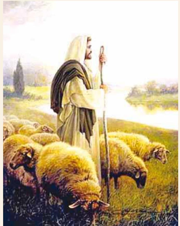
Eu sou o Bom Pastor, o Bom Pastor dá a sua vida pelas suas ovelhas” ( João, 10.11)

“Dar-vos-ei pastores segundo o meu coração, que vos apascentem com conhecimento e com inteligência”. (Jr 3.15)