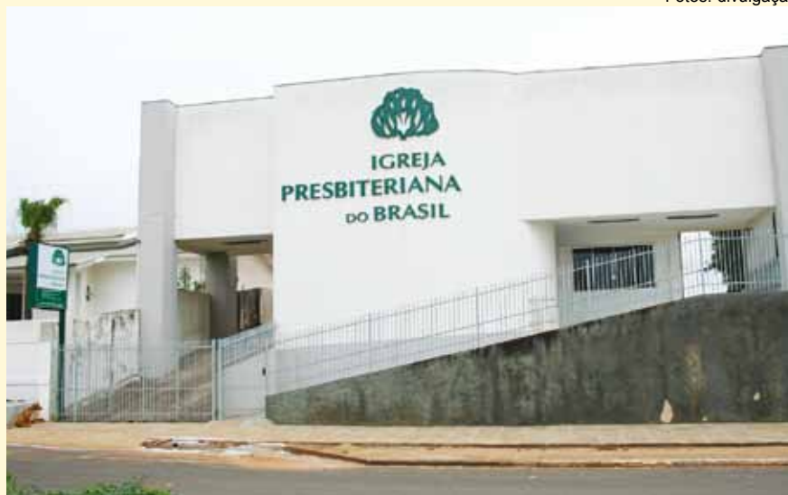
IP de Ibaiti