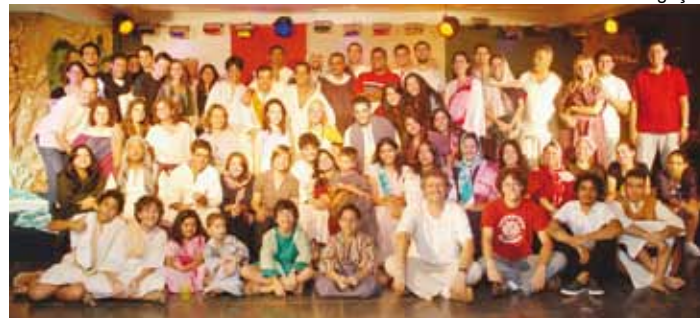
Mais de 60 pessoas estiveram envolvidas na produção do musical de Natal

A Igreja Presbiteriana do Lago Norte, Brasília, apresentou, nos dias 13 e 14 de dezembro de 2009, o musical de Natal “Emanuel – Deus Conosco”. Foi o segundo trabalho produzido pelo Ministério de Música e Artes daquela igreja. No ano passado eles apresentaram “Nasceu a Esperança”, baseado nas profecias do Velho Testamento que apontavam para o nascimento do Filho Deus.