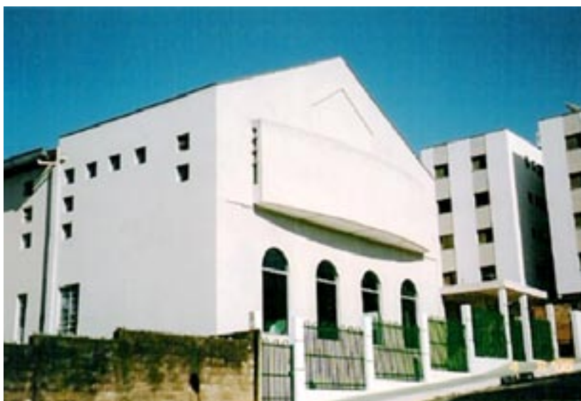
Fachada do Templo Escola do CEIP