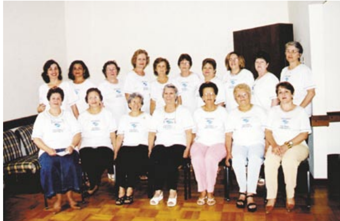
Atual Executiva Nacional da SAF

Outra grande vantagem do congresso é a comunhão e o estreitamento dos laços fraternais entre as sócias. Trocam-se experiências, adquirem-se novos conhecimentos, além da oportunidade de conviver com culturas, linguagens e