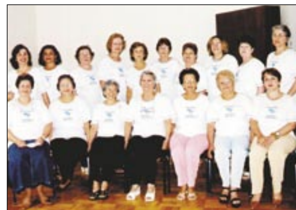
Saf realiza mais um encontro nacional