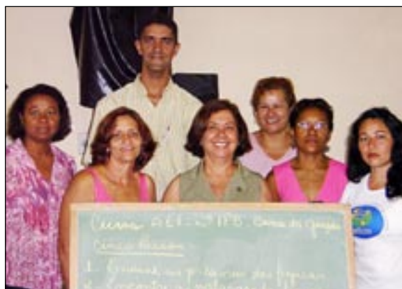
Presbiterianos evangelizam e alfabetizam com a Bíblia