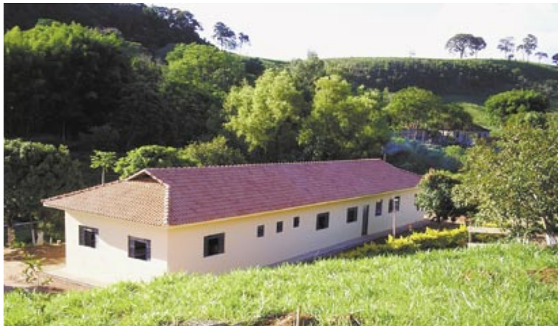
Sede do CERREVI, em Itajubá (MG)

Para a glória de Deus, o CERREVI não passa por problemas extremos. Tudo está em ordem, na medida do possível. Mas como toda entidade, conta com colaborações, voluntários comprometidos com o alvo, apoio de Igrejas, empresas e principalmente das orações incessantes, para que o trabalho continue atingindo seus objetivos e dando frutos. Mais informações no site www.geocities.yahoo.com.br/cerevi05 ou pelo telefone (35)3662-2214.