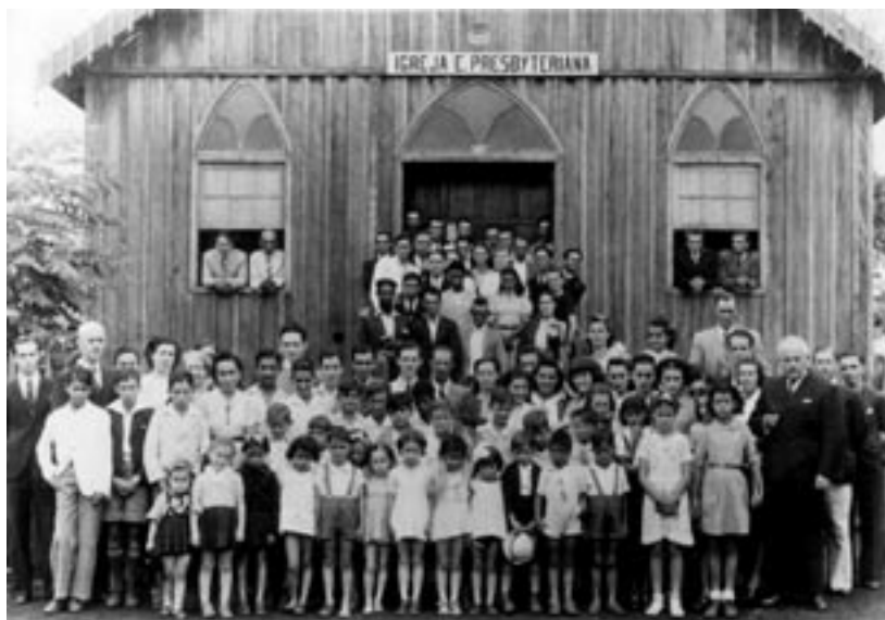
Primeiro templo de Londrina (PR), em 1940, quando a igreja tinha quatro anos.

Aos domingos, quando havia uma aglomeração maior de pessoas na cidade, líderes evangélicos estrategicamente voltavam os altifalantes fixados no topo dos templos, na direção da igreja católica, antes ou após a missa, fazendo leituras da Bíblia e pregações que denunciavam principalmente