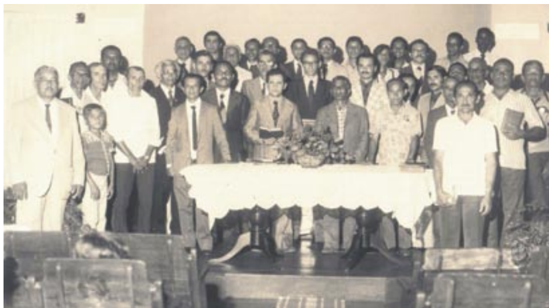
Foto histórica da IP de Canavieiras: Congresso de UPHs em janeiro de 1977

A celebração do centenário se iniciou exatamente um