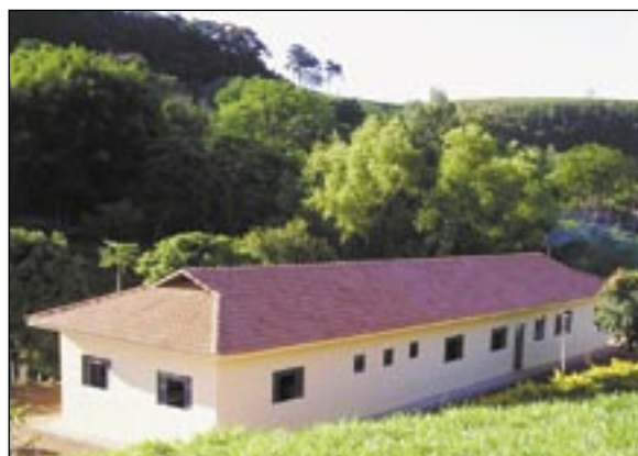
Projeto Cerevi recupera viciados em drogas em Minas Gerais