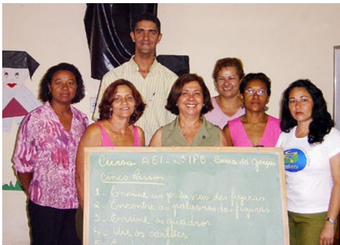
Formandos do primeiro Curso de Alfabetização e Evangelização por meio da Bíblia.

sor vai transmitindo o ensino bíblico que já possui”.