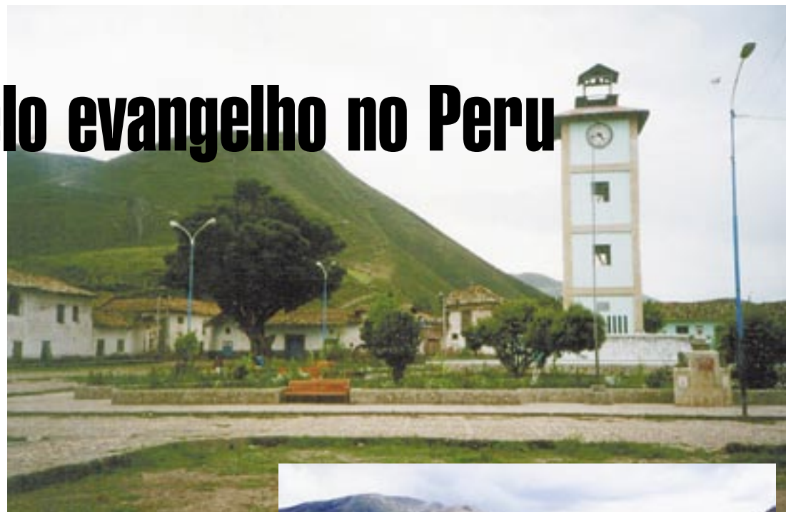
Cusco, antigo palco de uma nação rica e inteligente, hoje abriga uma população carente