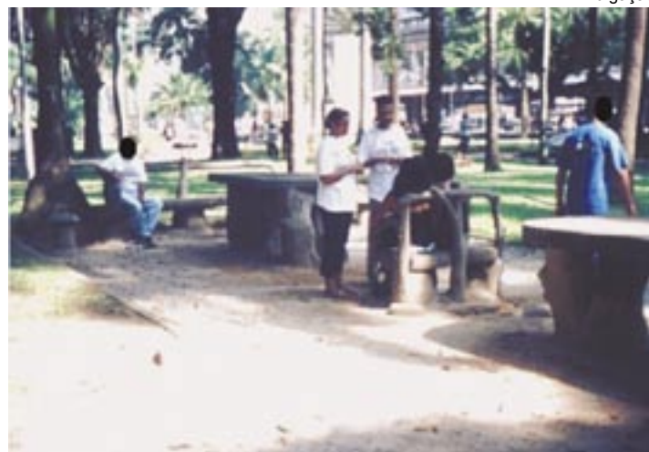
Praça da Luz, em São Paulo: missionários levam a Palavra de Deus aos que se prostituem

alvos a serem alcançados, como trabalhos nas favelas, em cadeias, que serão realizados com mais freqüência - uma vez por semana - com apoio espiritual, psicológico e jurídico e fazendo um elo ente o preso e sua família; elaboração de literatura adequada à evangelização, através de parcerias com entidades que trabalhem na elaboração de bons materiais didáticos; seminários nos