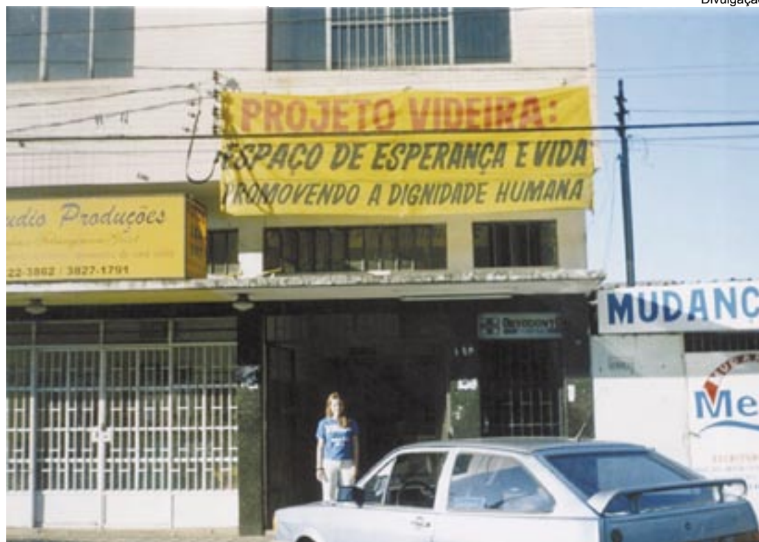
Sede do Projeto Videira: abrigando os excluídos com o amor de Jesus

“Graças a muito trabalho e ao prover de Deus, a Associação Projeto Videira é hoje uma realidade, gozando de crédito na região do Vale do Aço, inclusive com repor-