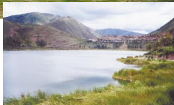
As ruínas incas atraem muitos turistas, o que ajuda um pouco a população local