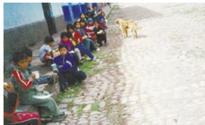
Foram distribuídos roupas, brinquedos e alimentos