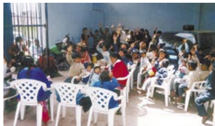
Em 2003, obreiros fizeram um mutirão para atender crianças necessitadas