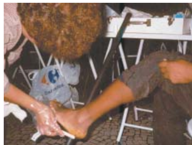
Colaboradora do Madrugada do Carinho faz curativo em morador de rua

to e paz. Num sábado, dia 30 de outubro, cinco igrejas pioneiras - entre elas a comunidade presbiteriana da Barra da Tijuca, lidera-