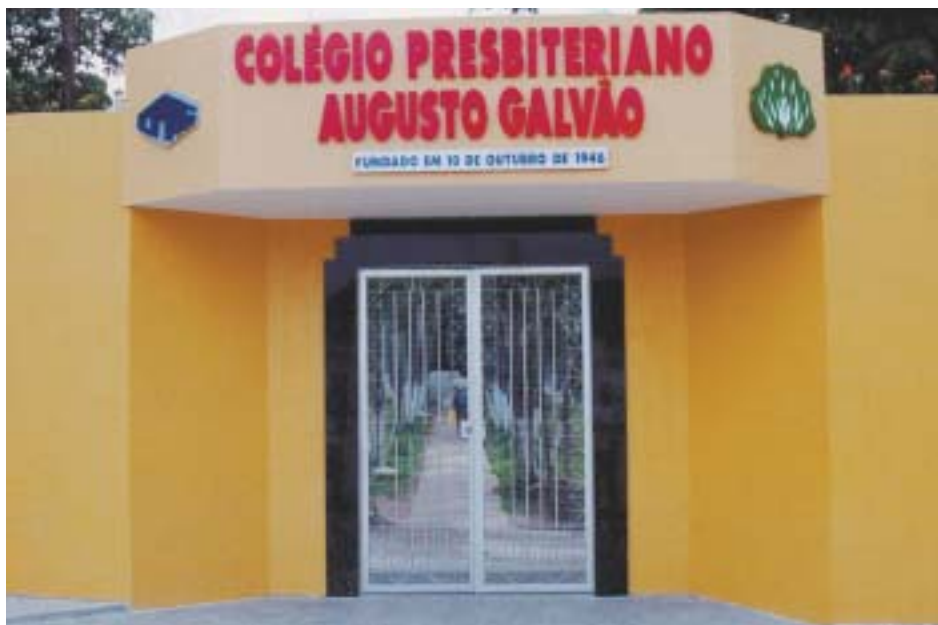
Escola em Campo Formoso filiada à Associação Baiana de Escolas Presbiterianas: unindo ensino à ministração da Palavra de Deus

Informações e contato pelo telefone (21) 32317300 ou pelo endereço no Rio de Janeiro, Av. Rio Branco 277, sala 302, CEP 20040-009.