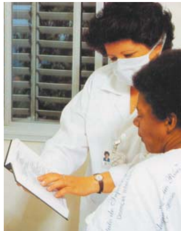
Sociedade Bíblica do Brasil