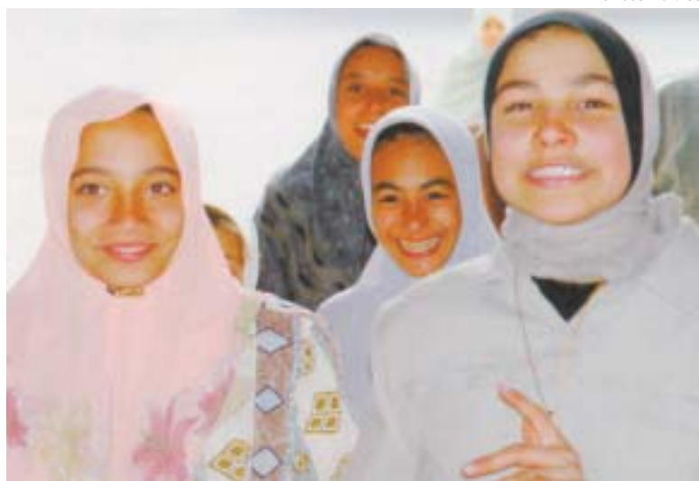
Voz dos Mártires