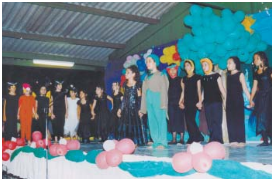
Apresentação da Terceira Série do Ensino Fundamental

"Tudo isto, somado ao desenvolvimento do processo de ensino e aprendizagem