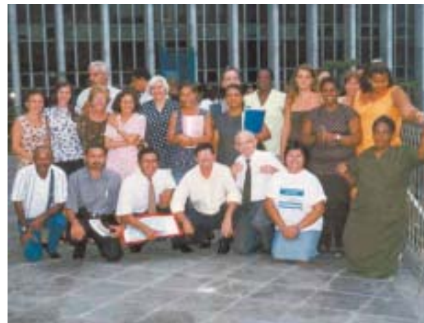
Colaboradores da Apas

"O traficante pediu para ficar na torre da igreja, porque lá, do alto, ele podia