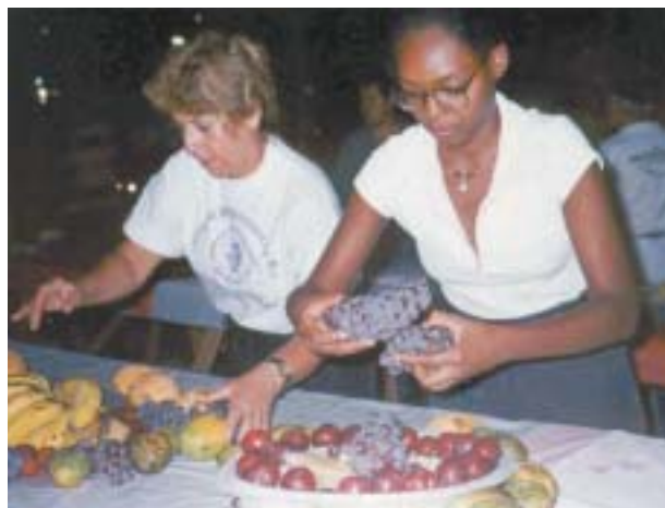
Noite Feliz para os moradores de rua expulsos de suas casas pela violência