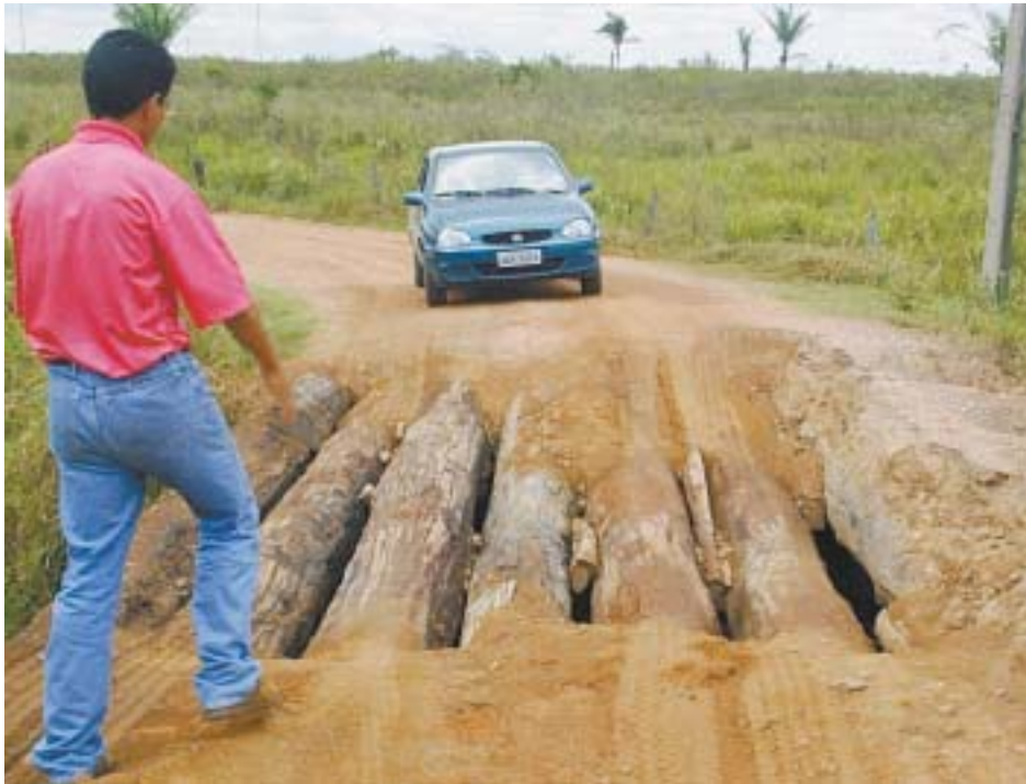
Uma das pontes-pinguela que os missionários da JPM/PRCA precisam atravessar para alcançar seus campos no sul do Pará