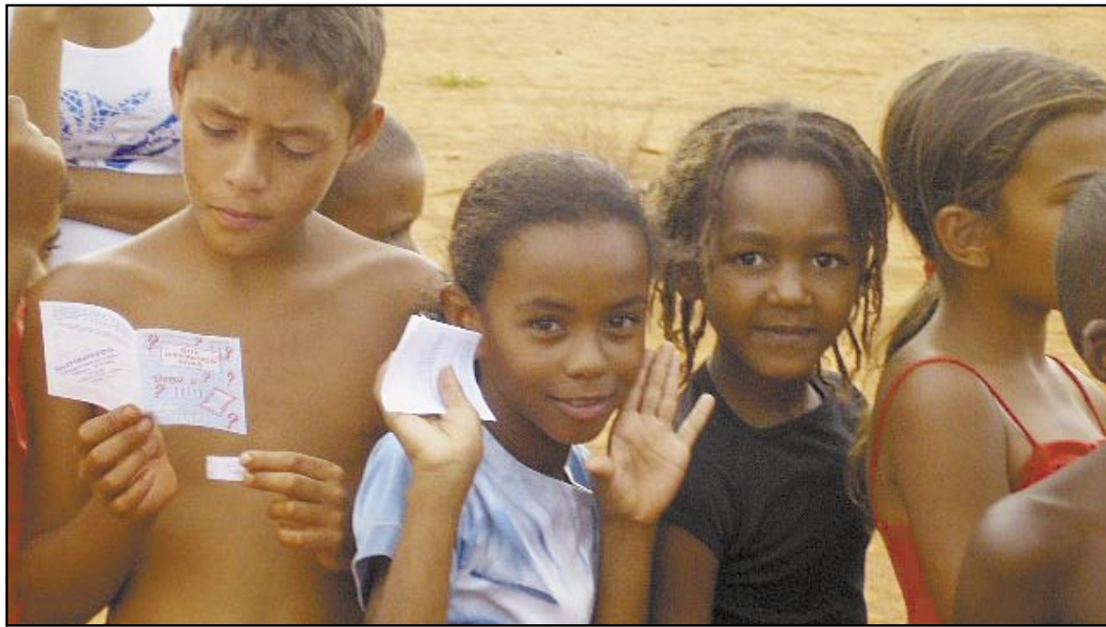
Crianças que receberam material escolar doado pela Segunda IP de Uberlândia