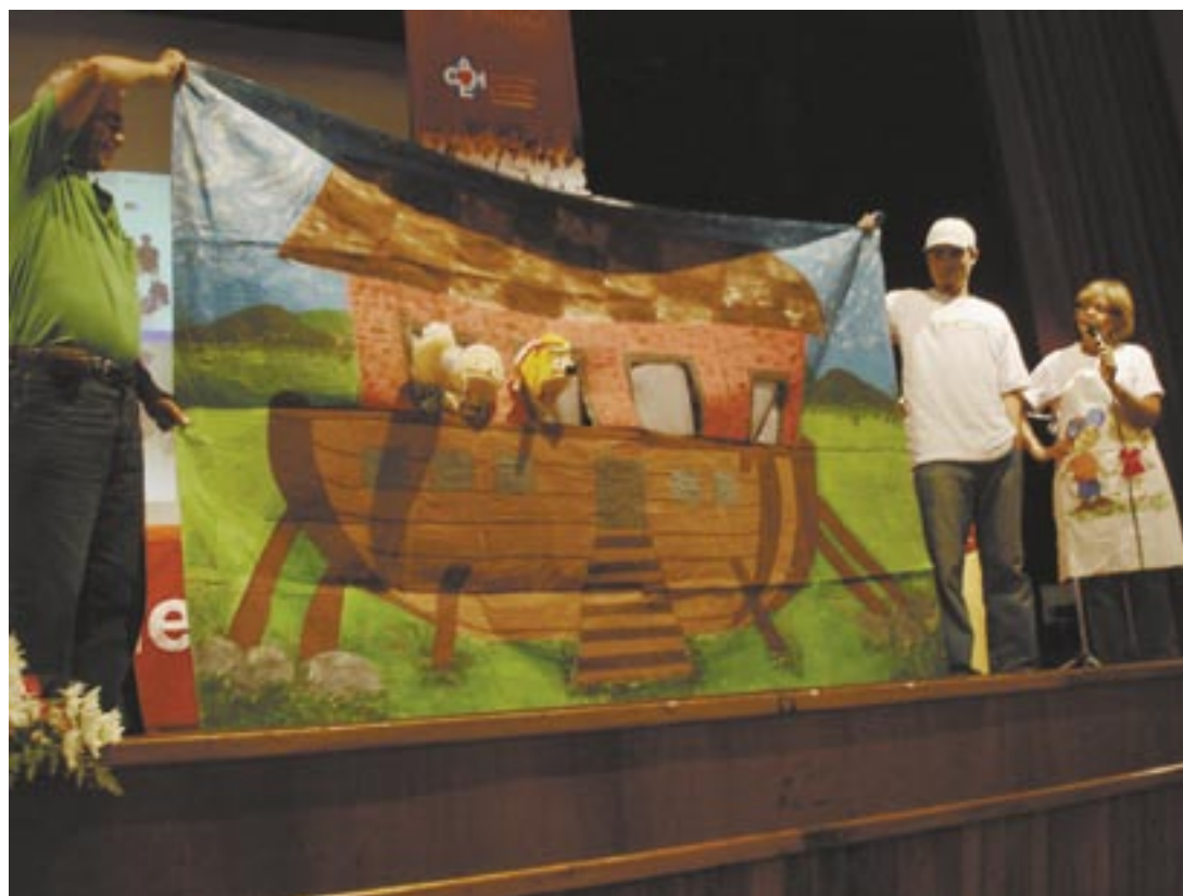
Participantes do seminário apresentam material da capelania a ser utilizado para trabalho com crianças

Mais informações no site www.capelania.com , ou pelo e-mail capelaniaevangelica@terra.com.br