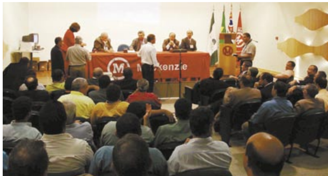
Verificação de poderes durante primeira reunião da Comissão Executiva do SC