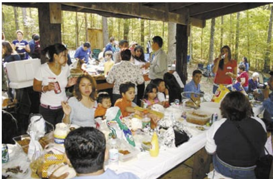
Piquenique com membros do trabalho missionário do rev. Ozéas: trabalho pastoral muito próximo do social

Se atualmente o trabalho engloba povos latinos, o desejo do rev. Ozéas é ter também um trabalho voltado exclusivamente para a evangelização de imigrantes brasileiros. Este trabalho já está em seu início, e deve render bons frutos em breve.