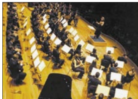
IPB analisa momento atual do louvor na liturgia