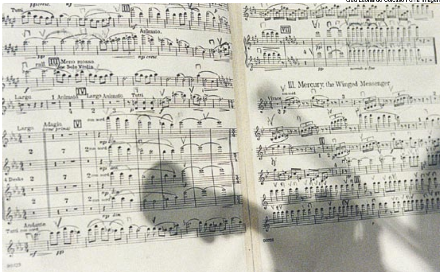
Tradição erudita: herança deixada pelos precursores do movimento evangélico brasileiro

Com o passar dos anos, instrumentos elétricos e manifestações populares tornaram-se parte de programações evangélicas voltadas a jovens,