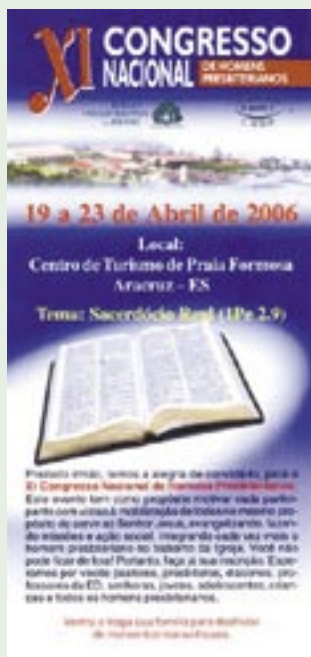
Cartaz do Congresso Nacional dos Homens Presbiterianos