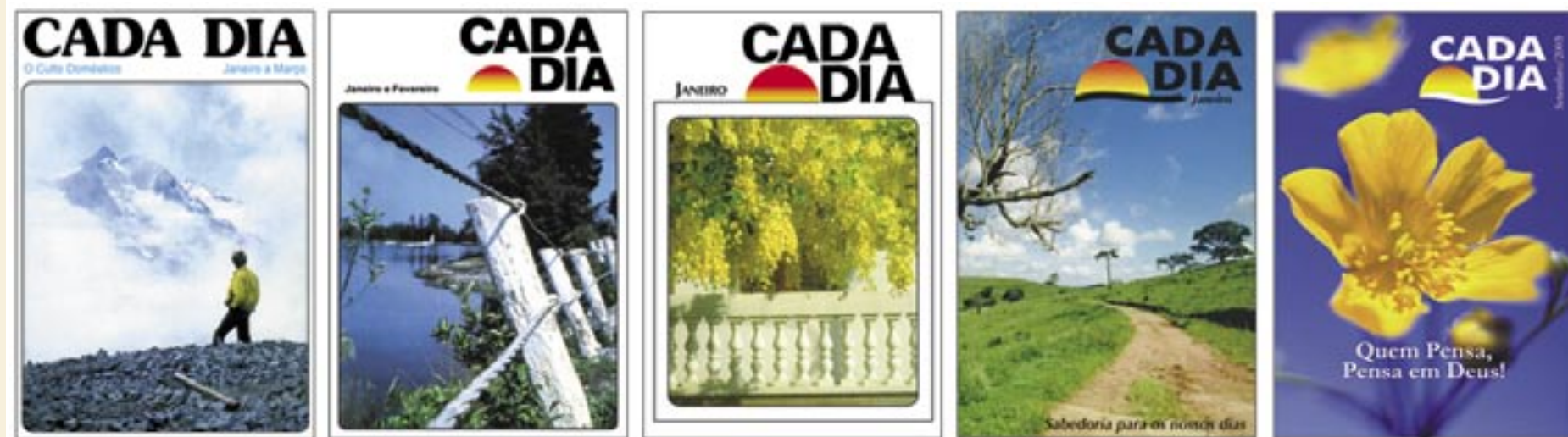
O "Cada Dia" é publicado mensalmente, cada livreto segue um determinado tema ou um seguimento de algum livro da Bíblia.

Edison Sousa e Rodrigo Duprat (fotos) Especial para o BP