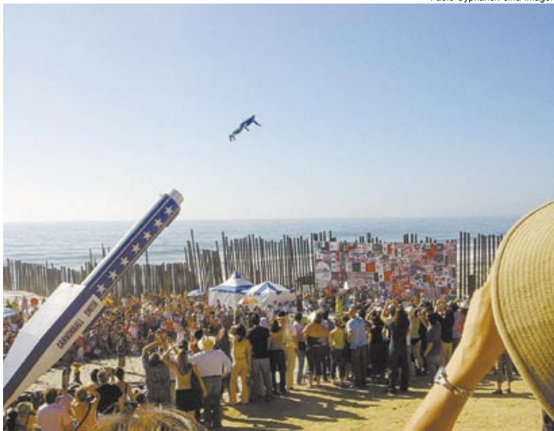
Protesto realizado na fronteira do México com os Estados Unidos contra a violência cometida a imigrantes ilegais

Em 2005, a Rede Globo transformou este drama em novela. E a história apresentada diariamente pela emissora não passou despercebida pelas autoridades norte-americanas. A segurança na fronteira com o México foi reforçada à época da trama global, e alguns Estados daquele país cresceram os