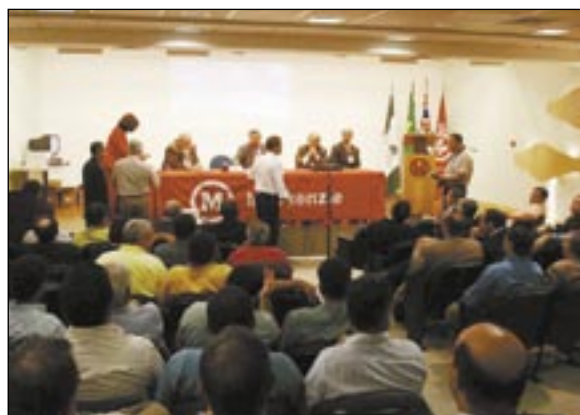
Comissão Executiva reúne-se em São Paulo