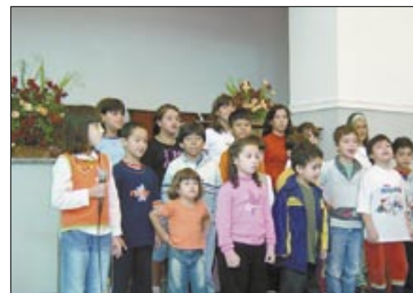
Educadoras infantis discutem o sentido da Páscoa cristã