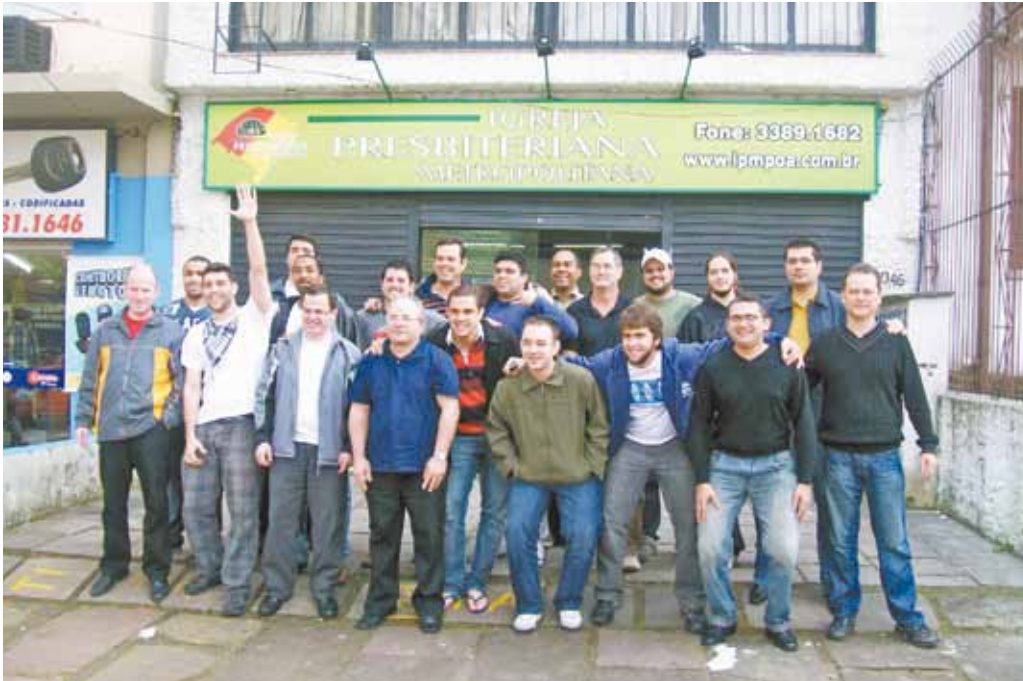
O grupo da quarta Viagem Missionária foi formado por 17 seminaristas