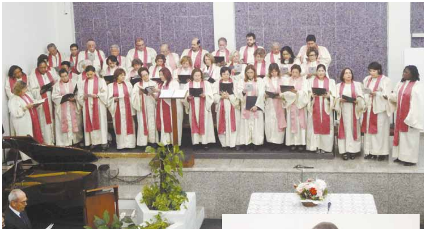
Coral da IP Unida

Em alta voz, o Credo Apostólico foi declara-