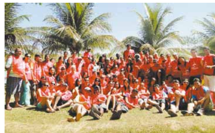
Equipe que trabalhou no Projeto Semear, no Tocantins

Dentro da programação, a Escola Bíblica de Férias desenvolveu atividades específicas para mais de 250 crianças, por dia de EBF. Já 21 mães aprenderam a bordar na oficina montada na cidade. As novidades dessa edição do Projeto Semear foram a emissão de carteiras de identidade, o bazar e curso de bordado.