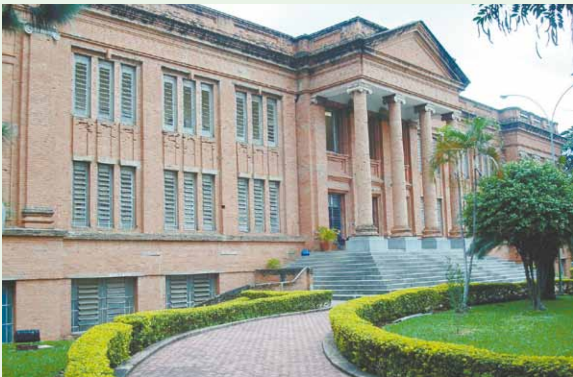
Seminário Presbiteriano de Campinas

tes e aos colegas, mesmo sabendo dos grandes riscos que corria. Hoje, 140 anos depois de sua chegada, seus descendentes continuam prestando valiosos serviços à Igreja Presbiteriana e à cidade de Campinas. Os túmulos desses e outros pioneiros podem ser vistos no Cemitério da Saudade.