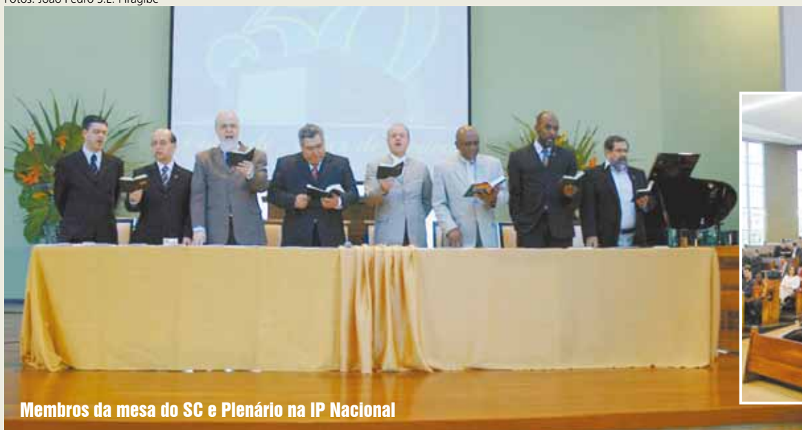
Membros da mesa do SC e Plenário na IP Nacional