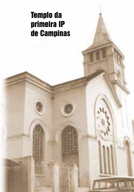
Templo da primeira IP de Campinas