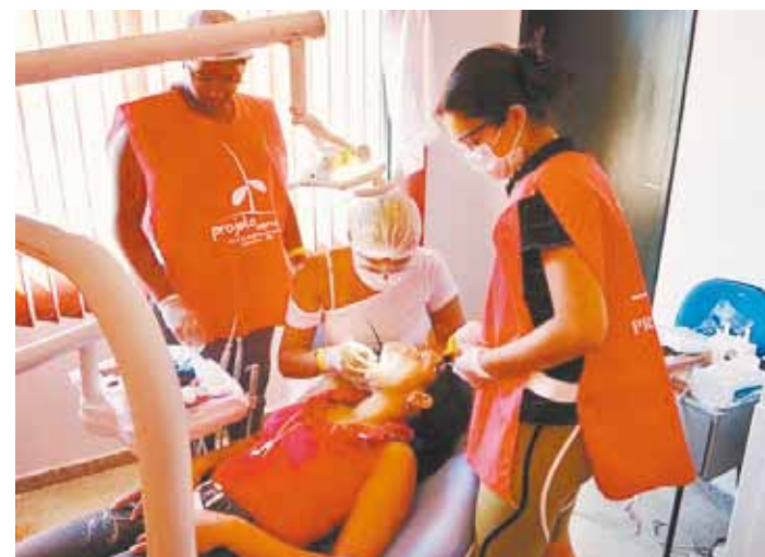
Foram realizados 52 atendimentos odontológicos